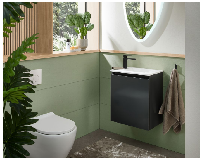
Marlin Serie Concept 10